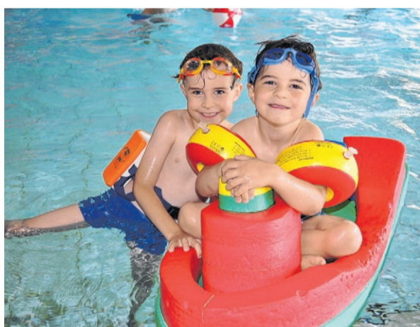
Kleine Wasserratten mit großem Spaß: Im Meckenheimer Hallenfreizeitbad kommen alle Altersgruppen auf ihre Kosten.

Wasserratten und alle, die in der heißen Jahreszeit eine Abkühlung suchen, dürfen sich freuen: Das Hallenfreizeitbad Meckenheim verlängert während der Sommerferien vom 15. Juli bis zum 27. August seine Betriebszeit und ist durchgängig von 10 Uhr bis 21 Uhr geöffnet (siehe Infokasten links). An den Wochenendtagen kommen Wasserratten zwischen 10 Uhr und 16 Uhr auf ihre Kosten. Lediglich montags bleibt das Hallenfreizeitbad geschlossen. Der Sprung ins kühle Nass lässt sich am Siebengebirgsring 6 exzellent mit einem Abstecher in die Sauna verbinden. Deren Öffnungszeiten bleiben in den großen Ferien unverändert.