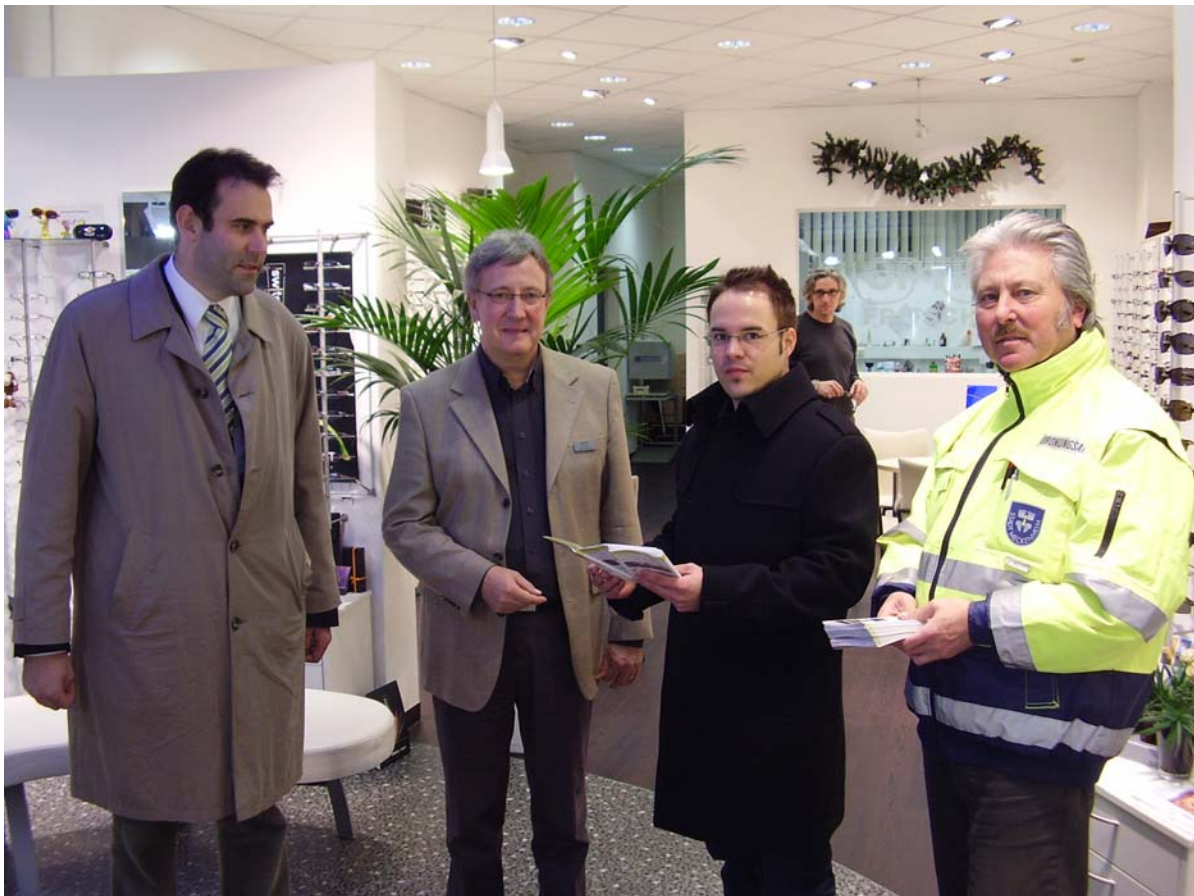
Erstes Verteilen der Flyer in den Geschäften

Zusätzlich soll nun der Ordnungsaußendienst die in Meckenheim ansässigen Geschäfte besuchen, weiträumig die Meckenheimer Bevölkerung über die Arbeit des Ordnungsaußendienstes informieren und auch den vor einigen Wochen erstellten Info-Flyer verteilen.